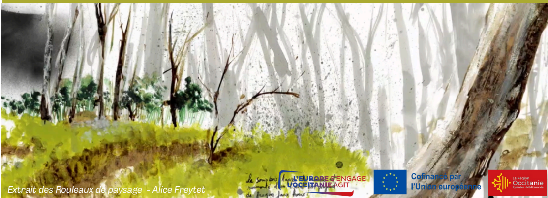
Extrait des Rouleaux de paysage - Alice Freydet

Un outil au service du développement du territoire